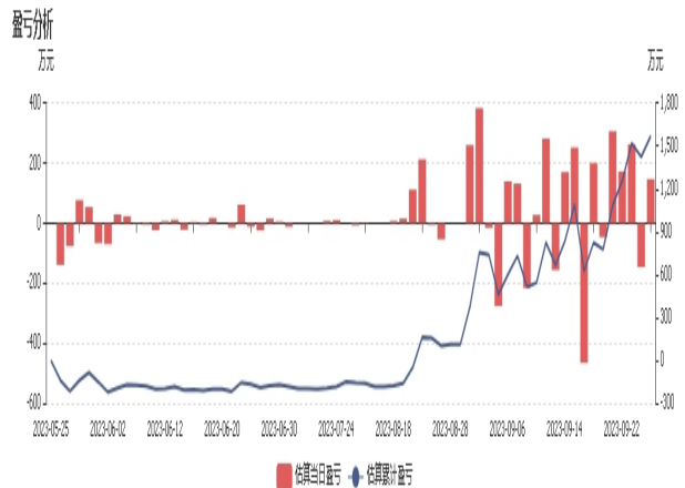
图2：永安期货持仓盈亏分析