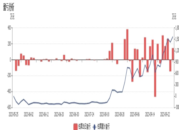
图2：永安期货持仓盈亏分析