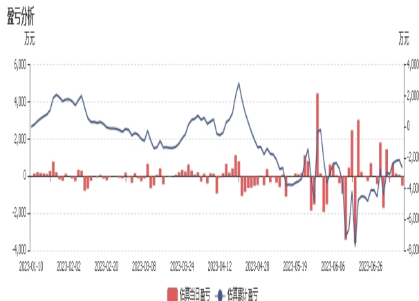
图2：永安期货持仓盈亏分析