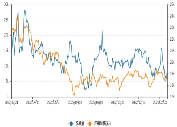
图2：永安期货多单持仓与沪铝价格走势